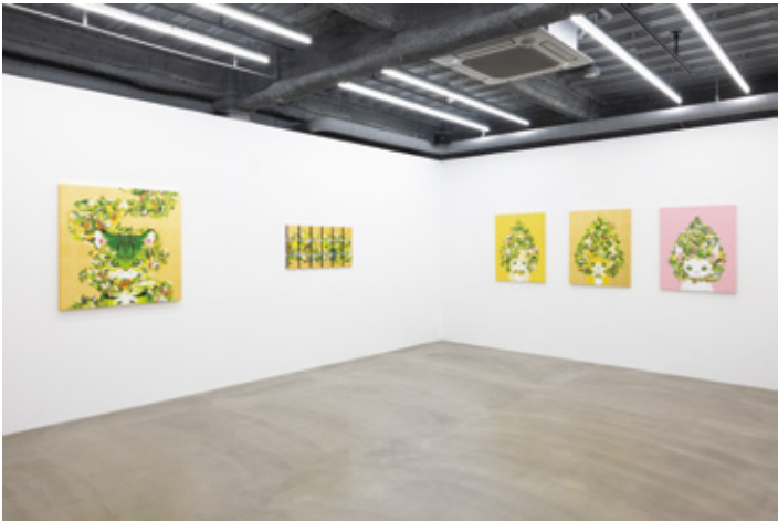
Solo Exhibition "Piece of a mountain" at TEZUKAYAMA GALLERY, Osaka , 2023