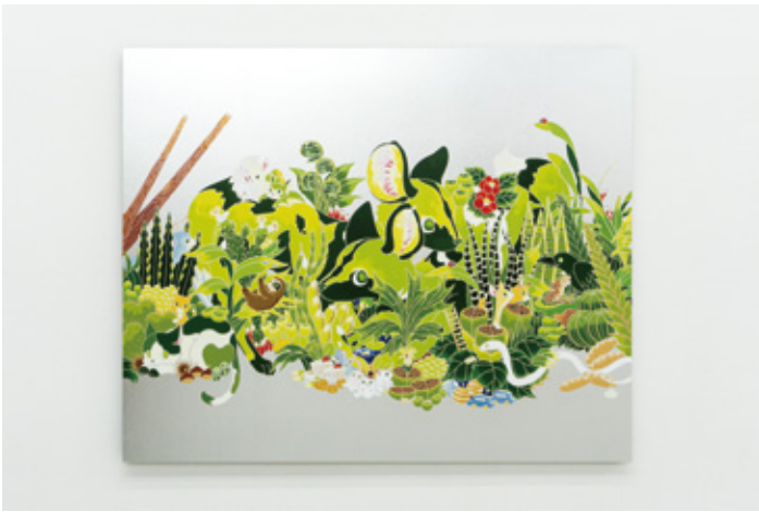
parade(lycaon) 2025 acrylic, aluminium leaf-paper on panel H652 x W803 x D22mm