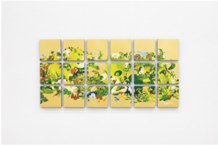
Parade grid (Badger) 2022 acrylic, brass leaf-paper on panel H150 × W150 × D22 mm × 18 piece