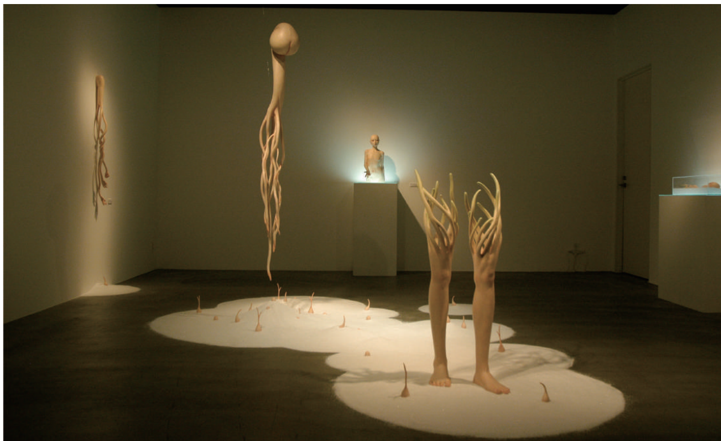
Solo Exhibition "鼓動" (2012) / Venue: TEZUKAYAMA GALLERY