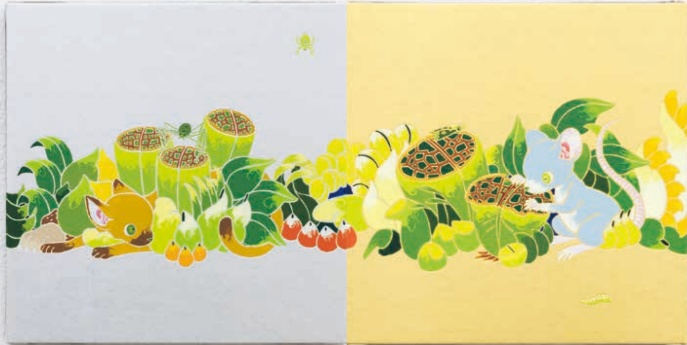
Little parade (Harvest) 2022 | acrylic, silverleaf-paper on panel 180 × 180 × 22 mm