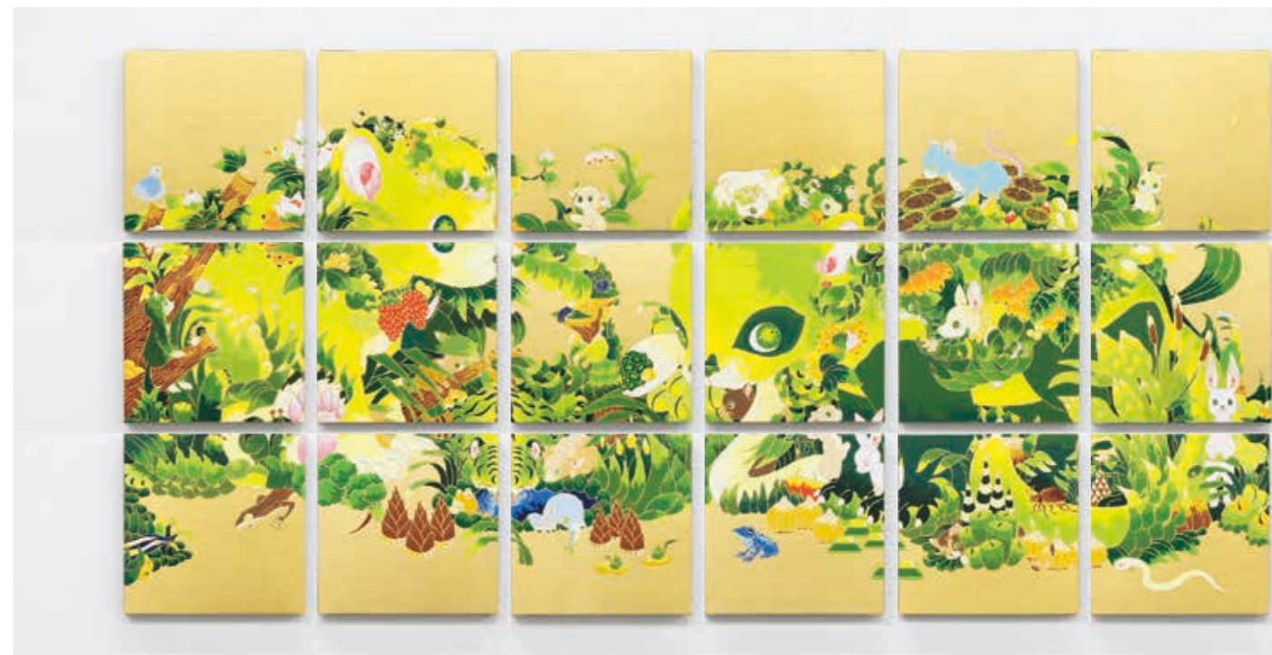
Parade grid (Badger) 2022 | acrylic, goldleaf-paper on panel 150 × 150 × 22 mm × 18pieces