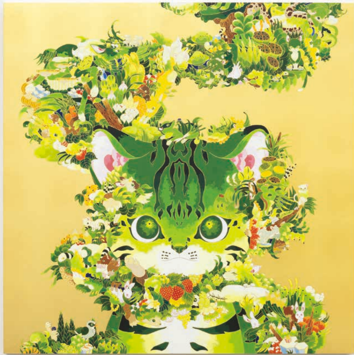
Gift 2023 | acrylic, goldleaf-paper on panel 1000 × 1000 × 60 mm