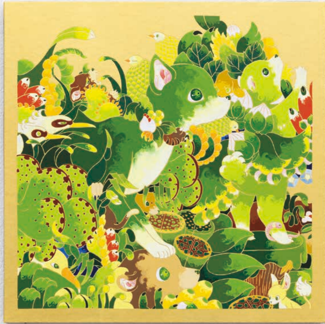
Frame frame "Cat" 2022 | acrylic, goldleaf-paper on panel 333 × 333 × 22 mm