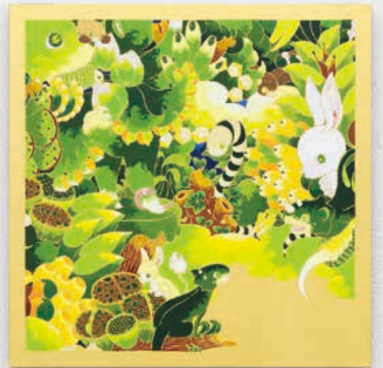
bottom left: Frame frame "Iguana" 2022 | acrylic, goldleaf-paper on panel 333 × 333 × 22 mm