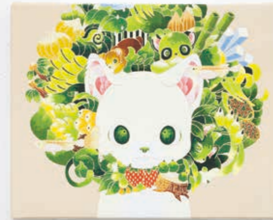
One tree (Beige) 2022 | acrylic on canvas 220 × 273 × 20 mm