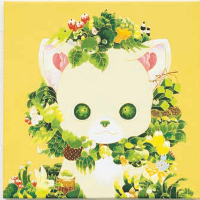
One growing (Yellow) 2022 | acrylic on canvas 273 × 273 × 20 mm