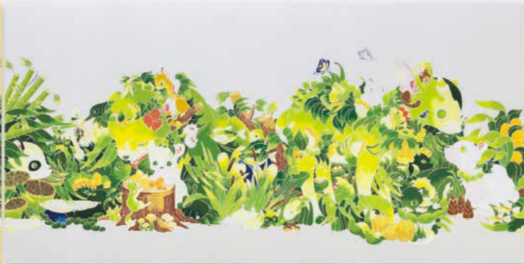
Parade (Muntjac) 2022 | acrylic, silverleaf-paper on panel 450 × 900 × 22 mm