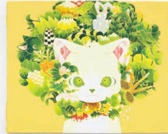
One tree (Yellow) 2022 | acrylic on canvas 220 × 273 × 20 mm