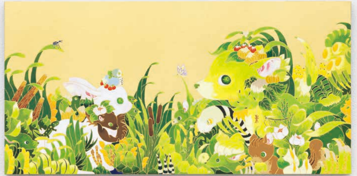
Bush 2023 | acrylic, goldleaf-paper on panel 300 × 600 × 22 mm