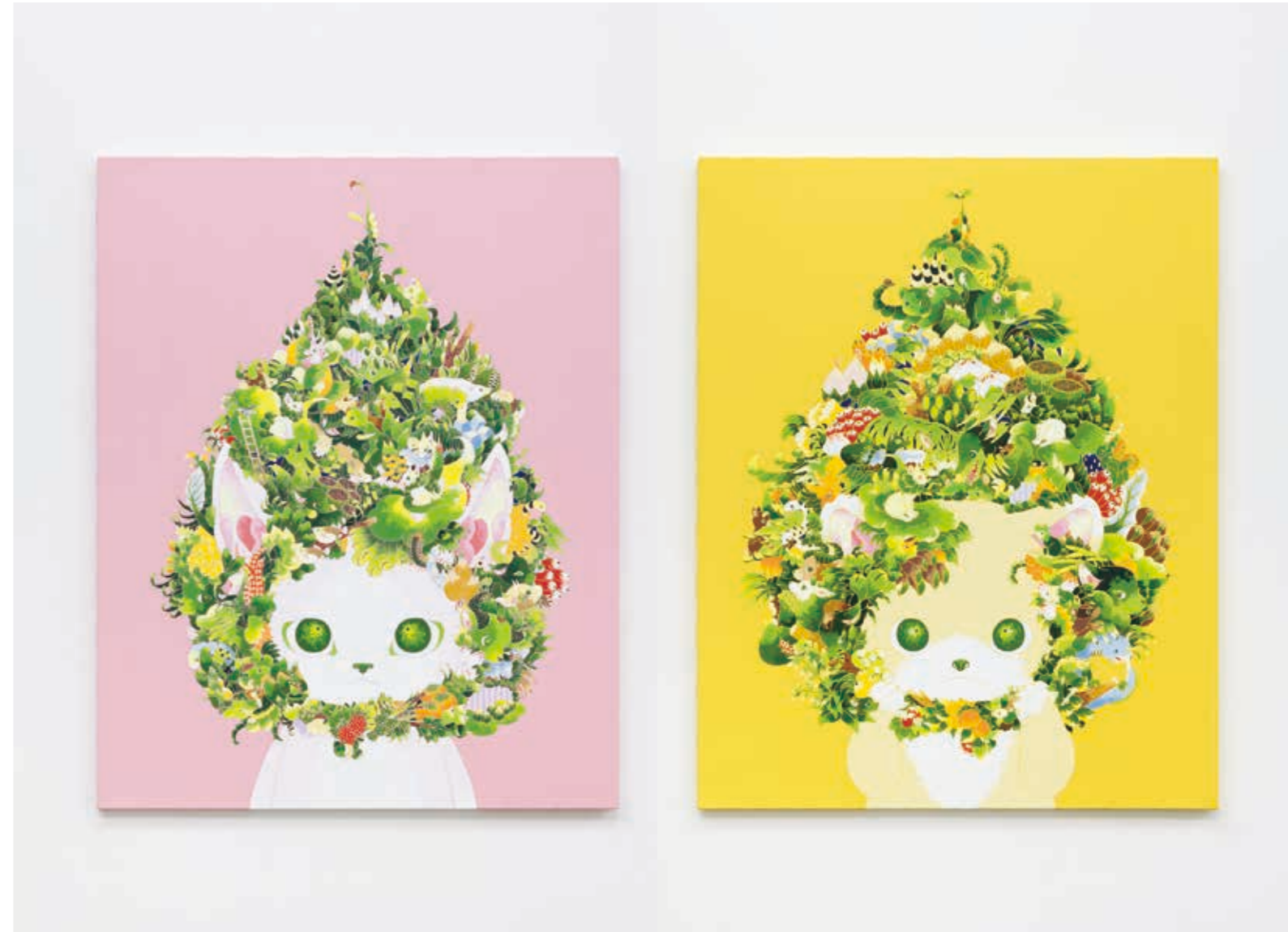
A tree (Pink) A tree (Yellow) 2022 | acrylic on canvas 2022 | acrylic on canvas 910 × 727 × 22 mm 910 × 727 × 22 mm