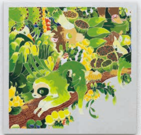
top right: Frame frame "Sloth" 2022 | acrylic, silverleaf-paper on panel 333 × 333 × 22 mm