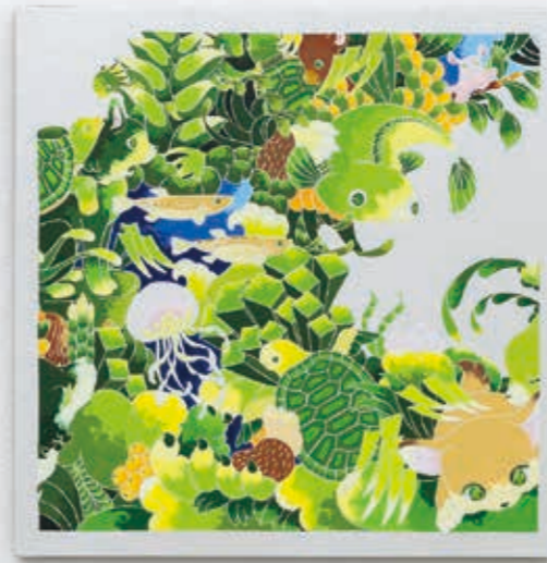
top left: Frame frame "Turtle" 2022 | acrylic, silverleaf-paper on panel 333 × 333 × 22 mm