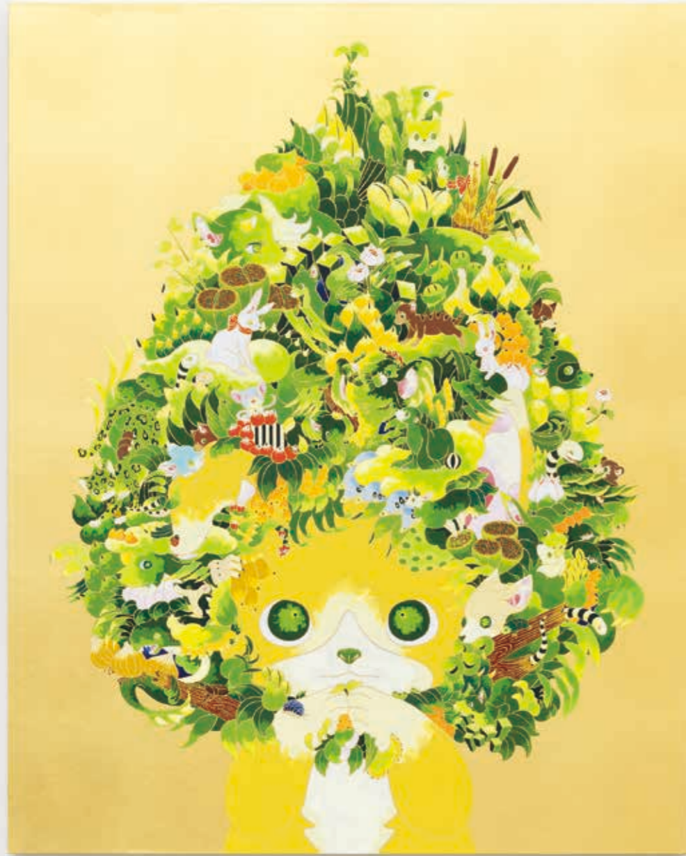
A tree (Gold) 2022 | acrylic, goldleaf-paper on panel 910 × 727 × 22 mm