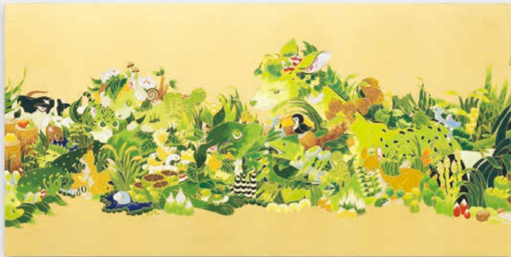
Parade (Bambi) 2023 | acrylic, goldleaf-paper on panel 450 × 900 × 22 mm