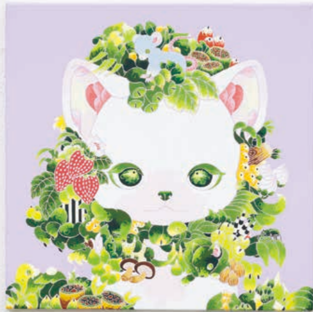
One growing (Purple) 2022 | acrylic on canvas 273 × 273 × 20 mm