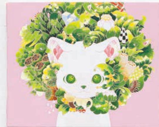
One tree (Pink) 2022 | acrylic on canvas 220 × 273 × 20 mm