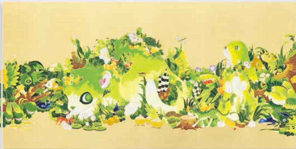
Parade (Cricket) 2022 | acrylic, goldleaf-paper on panel 450 × 900 × 22 mm