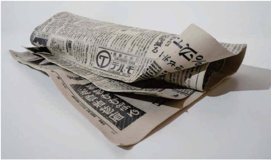
三島喜美代, Newspaper 74, 1974, Ceramic