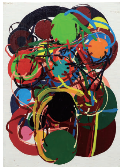
田中敦子 Untitled 1970 Enamel on canvas