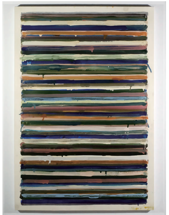
山田正亮, Work C.p46, 1960, Oil on paper