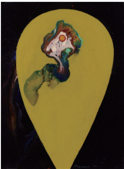
元永定正 Untitled 1966 Oil on canvs