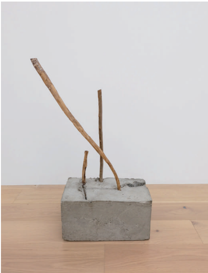
菅木志雄, Untitled, 1980, Wood and cement