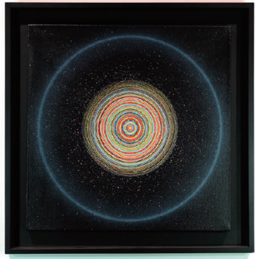
桑山タダスキー, Untitled, circa 1960's, Aclyic on canvas