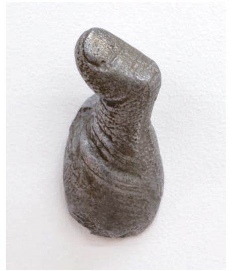
三木富雄, Finger, 1966, Aluminum