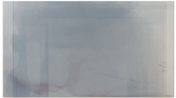
A morning glow #1 / 2020 / cashew on wooden panel / H990 × W1765 mm Private Collection