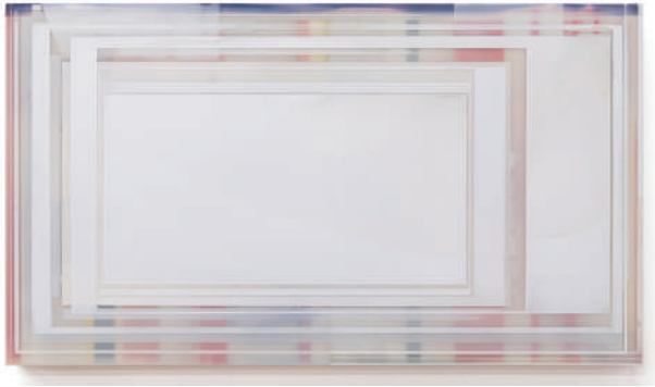
Scan #12 / 2020 / cashew on wooden panel / H315 × W560 mm Private Collection