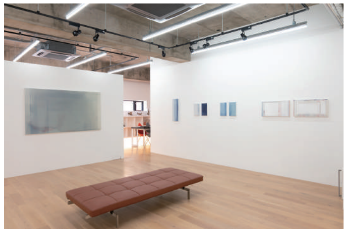
Installation View of 'FOCUS - Four Painters' at TEZUKAYAMA GALLERY / 2020