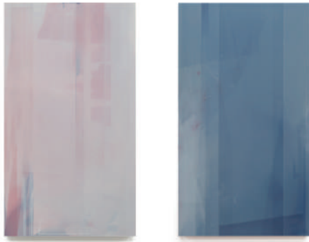
A graph #35 / 2020 / cashew on wooden panel / H560 x W315 mm Private Collection