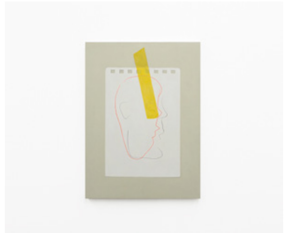
41 year old spriog (2021), acrylic on canvas, H910xW727mm ©Yoshiyuki Ooe