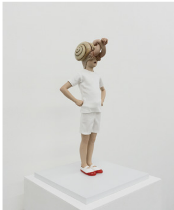
*Left to Right Fired Bird (2021) mixed media H620xW332xD332mm ©Yoshiyuki Ooe アイマイマン (2021) mixed media H570xW332xD332mm ©Yoshiyuki Ooe