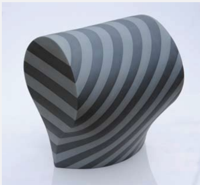
Form102From212, 2014, porcelain, D230 × W240 × H275 mm