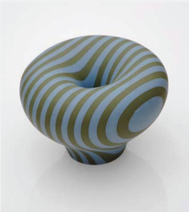
Form82From12, 2014, porcelain, D230 × W230 × H150 mm