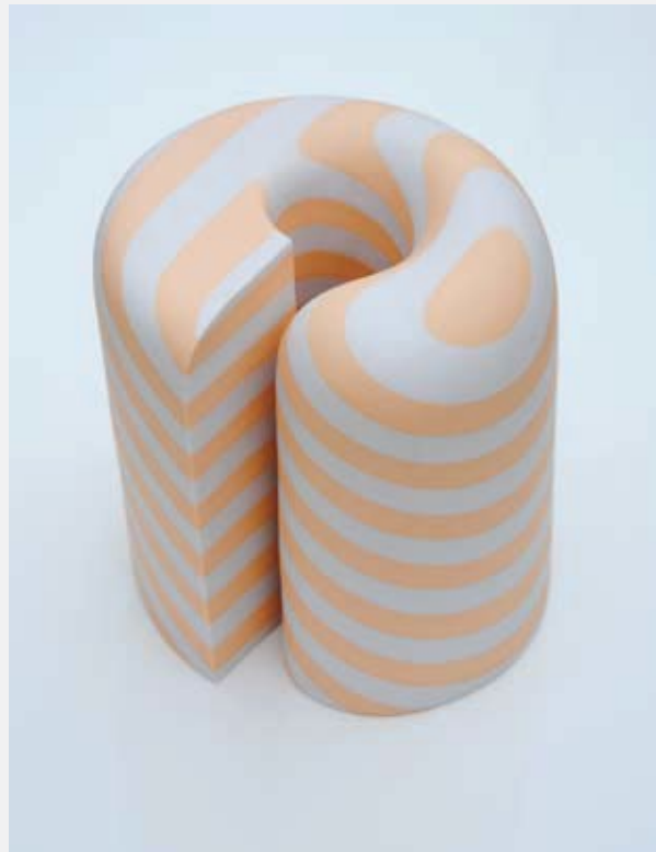
Form113From20, 2014, porcelain, D240 × W250 × H200 mm