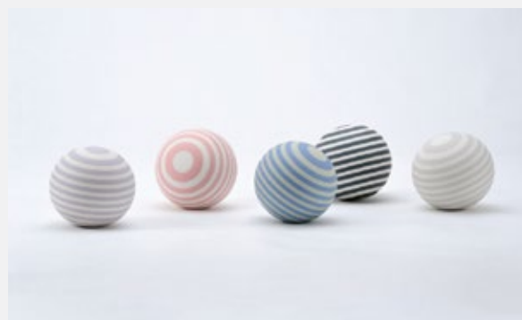
Form92From11, 2009, porcelain, D180 × H175 mm