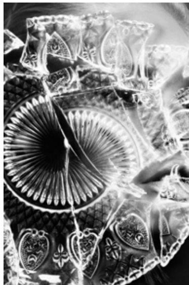
Lost idea #3 2014 ink-jet print 60.4 x 40.4 cm