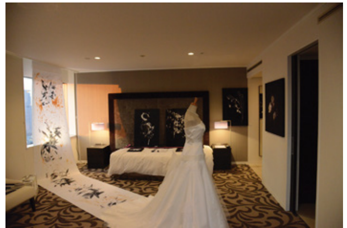
Art Osaka インスタレーションビュー, 2014