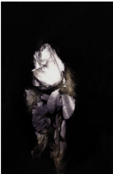
Condolence//バラ 2013 ink-jet print on cloth on panel, ash 80.3 x 53 cm