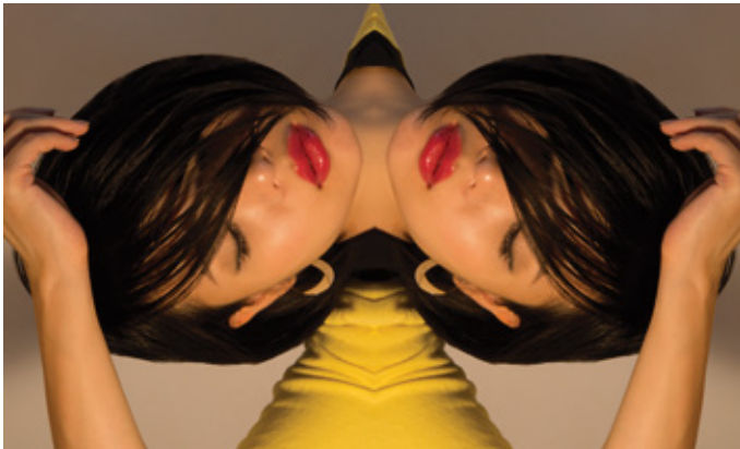
双頭 (新作), 2016, ink-jet printo mounted with plexiglas, 90 x150 cm