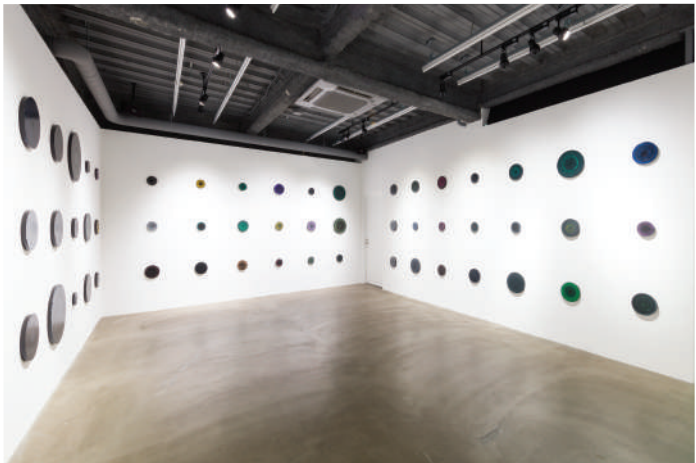
Solo Exhibition "Exhibition 2019" at TEZUKAYAMA GALLERY, Osaka (2019)