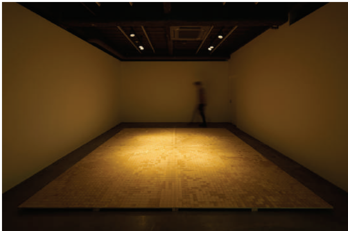
Solo Exhibition "Exhibition 2018" at TEZUKAYAMA GALLERY, Osaka (2018)