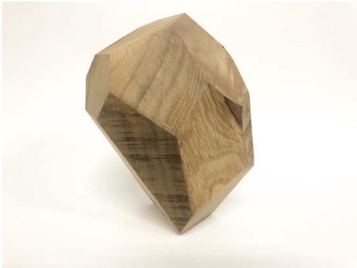
クスノメテオ #4 2019 camphorwood, wax H160 x W130 x D120 mm