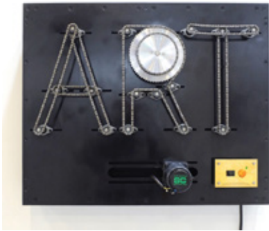
ART MACHINE #2 2016 Steel, chains, bearings, motors...etc, H52.5 x W65.0 x D20.5 cm