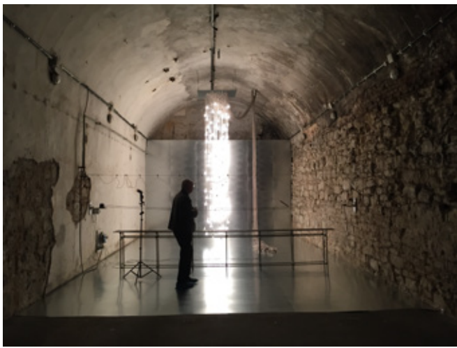
International Light Art Award 2017, Unna Germany