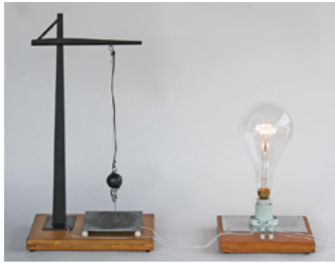
Point of Contact for Incandescent Lamp #28 2017 Incandescent lamps, aluminum, steel, codes, motors...etc, L: H67.5xW36.5 x D27.5Dcm R: H42 x W 27.5 x D27.5 cm