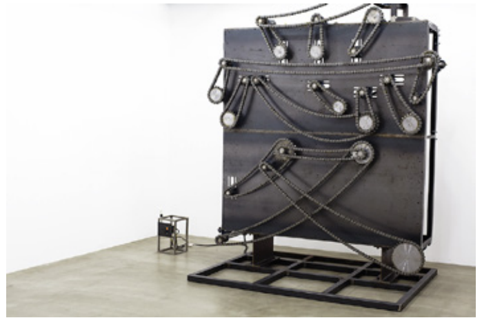
個展「愛マシーン」展示風景 (2014)