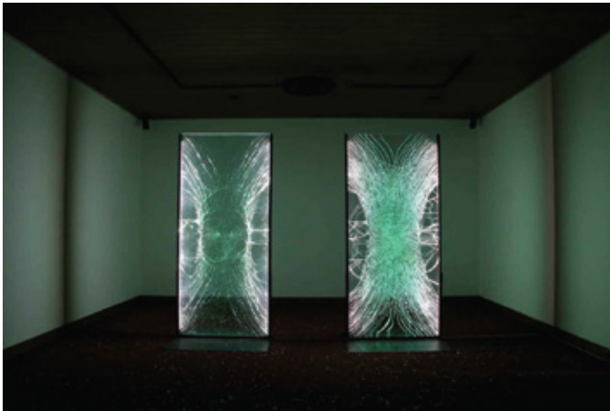
maneibi, 2007, glass, LED light, iron, 100 x 200 x 90 cm (each size)