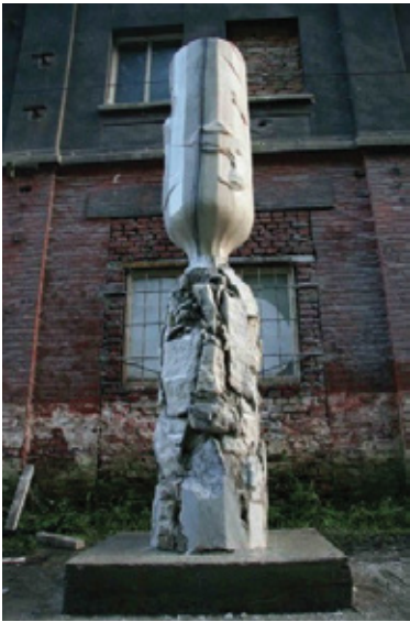
circle of life 2010 marble, beton 64 x 360 x 64 cm