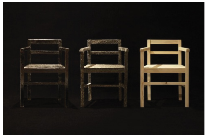
chairs, 2014, wood, epoxy, 56 x 81 x 44 cm (each size)