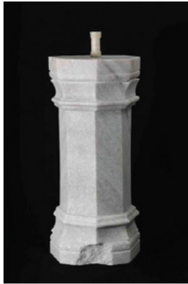
base based on base No.2 2011 marble 30 x 65 x 30 cm