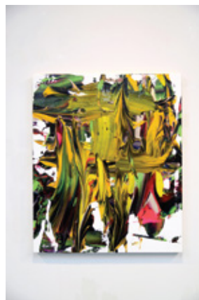
Sound 3 2019 Acrylic, carborundum, cotton cloth 731 x 609 mm