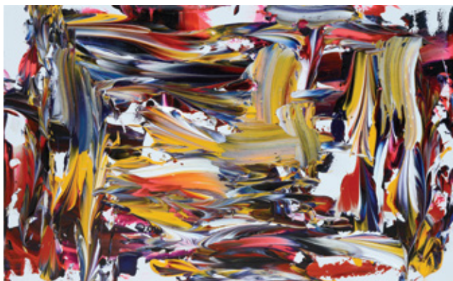
海鳴り, 2019, Acrylic, carborundum, cotton cloth, 895 x 1456 mm