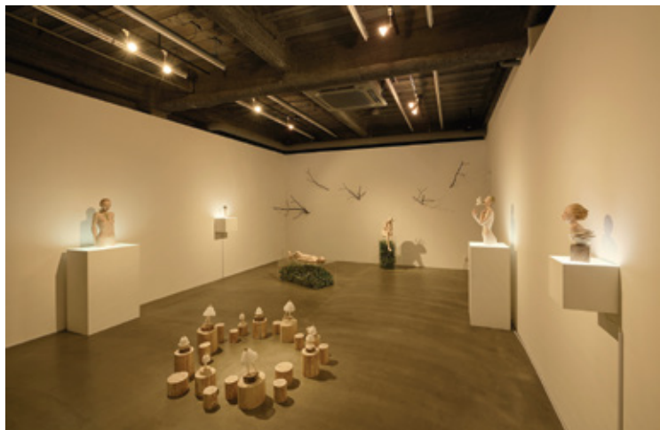
Exhibition View: 上原浩子 個展「Deep Forest」, 2018 / TEZUKAYAMA GALLERY