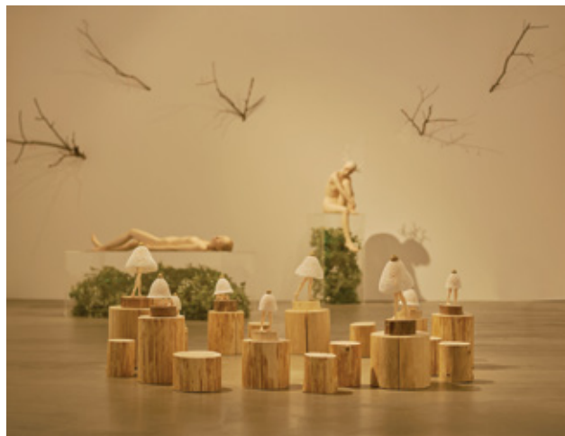
Exhibition View: 上原浩子 個展「Deep Forest」, 2018 / TEZUKAYAMA GALLERY