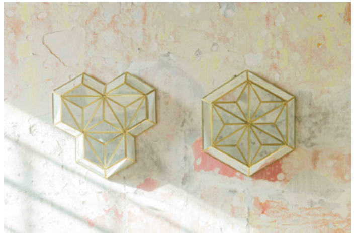
kaleidoscope no.3 / 2021 / mirror, brass