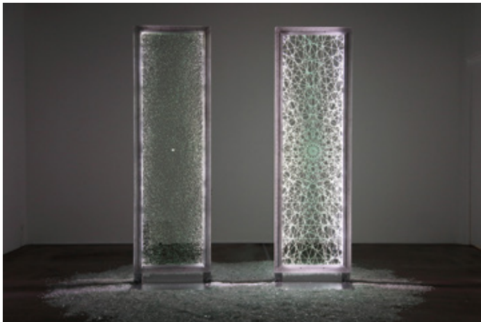
Exhibition View: Solo Exhibition 'tear' (2016) / TEZUKAYAMA GALLERY - Main Gallery