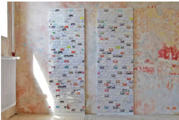
monos no.2 / 2019 / business card, plexiglass, magnet, screw, wooden panel