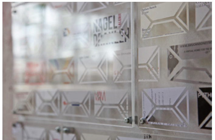
monos no.2 - detail / 2019